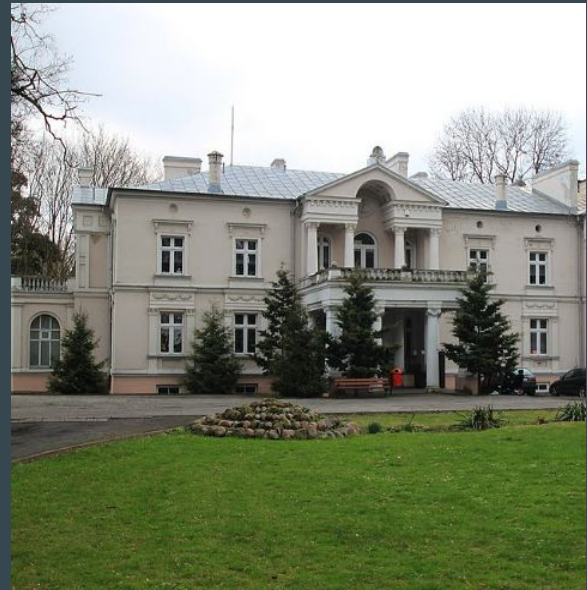
Pałac w Ugoszczu